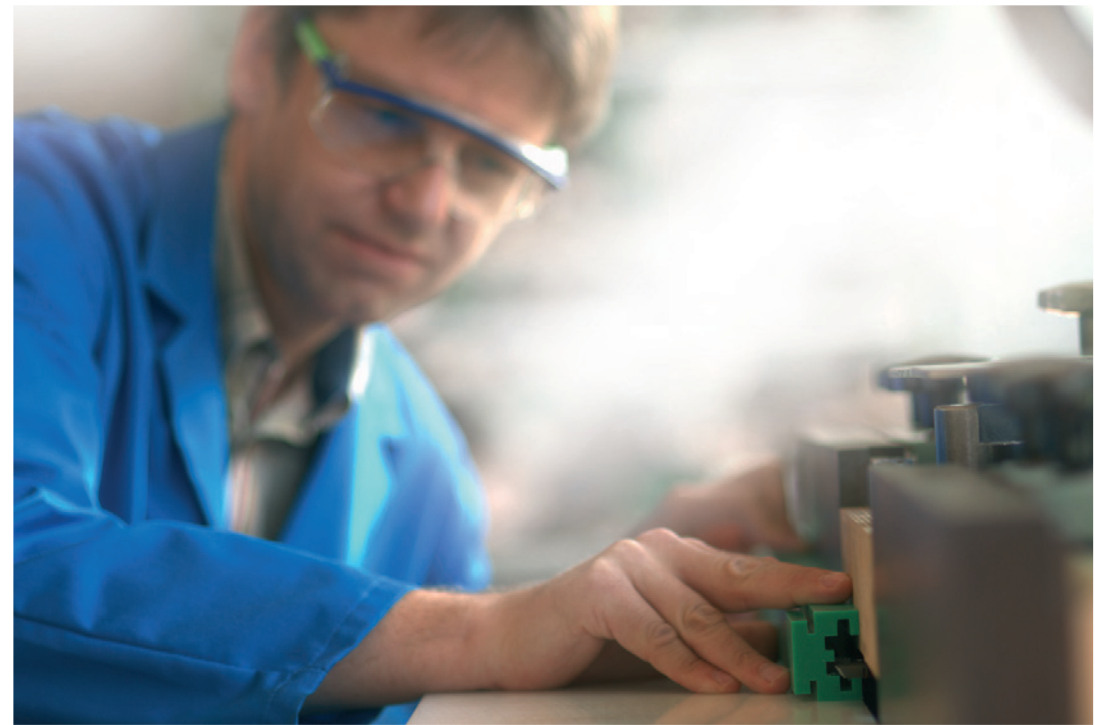
Service de débitage de profils

Grâce à son très large éventail de produits disponibles de stock, aux performances des machines de ses ateliers et à la compétence de ses collaborateurs,