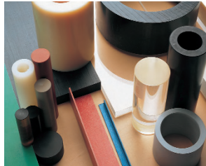
Un large éventail de semi-produits fabriqués à partir de plus de 80 matières plastiques différentes

Le service et la satisfaction du client sont deux aspects clés de la relation entre une entreprise industrielle et ses fournisseurs. Pour se démarquer de la concurrence, Angst+Pfister a décidé il y a peu d'élargir la gamme de prestations de service de son secteur Matières plastiques. Son centre logistique européen a en effet agrandi ses ateliers et propose un service de découpe rapide et efficace de jets ronds, de tubes et de plaques en matière plastique.