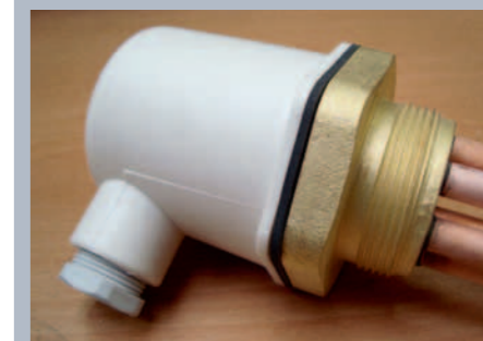
Hlavice tělesa s těsněním