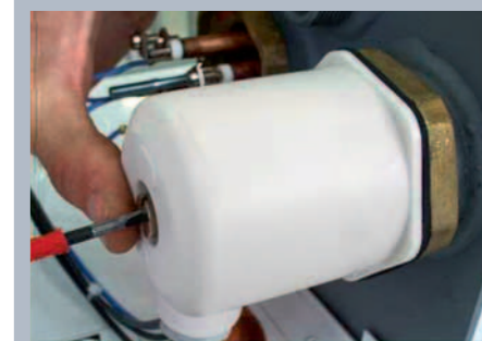
Montáž tělesa do finálního výrobku