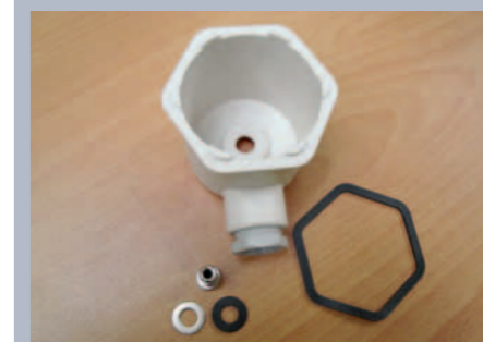
Demontovaná hlavice s těsněním Angst+Pfister