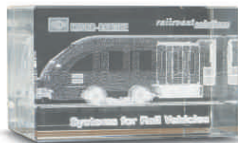
L'Oscar 2008 du meilleur fournisseur a été décerné à Angst+Pfister