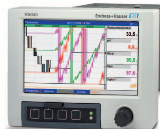
Memograph M avec écran TFT de 7 pouces