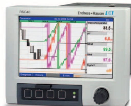
Registratore videografico con monitor TFT 7 pollici