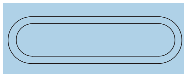
Guarnizione a labbro

Sfruttate anche voi il nostro bagaglio di esperienze e puntate su una collaborazione duratura. Contattateci.