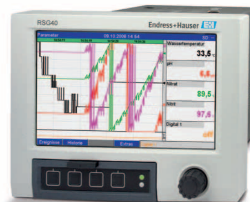
Memograph M met 7-inch TFT-monitor